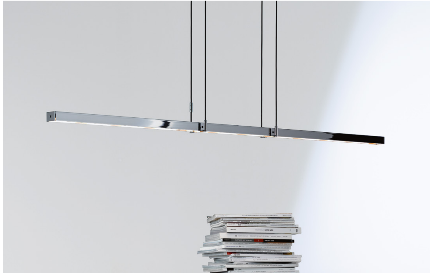
TIESO TENDER, Rolf Heide, 2001